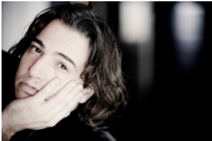
Fazil Say